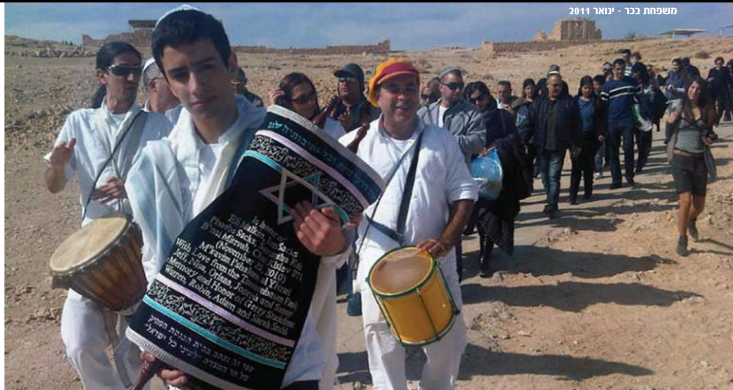
משפחת בכר - ינואר 2011

באחד המערכונים של "ארץ נהדרת" מגלמת השחקנית שני כהן את הילדה קשת ליכליך, זאת שדורשת שאב'ש ואמו'ש שלה יארגנו לה בת מצו'ש מהסרטים: מינימום ג'סטין ביבר. (ובעברית: הילדה הכי מפונקת בטלוויזיה דורשת אירוע גרנדיוזי לכת המצווה שלה). האם המערכון הזה הוא מראה מדויקת של פני הדור? לא בדיוק. הנה: יותר ויותר בני נוער מצווה בוחרים לערוך את החגיגות דווקא על המצדה.